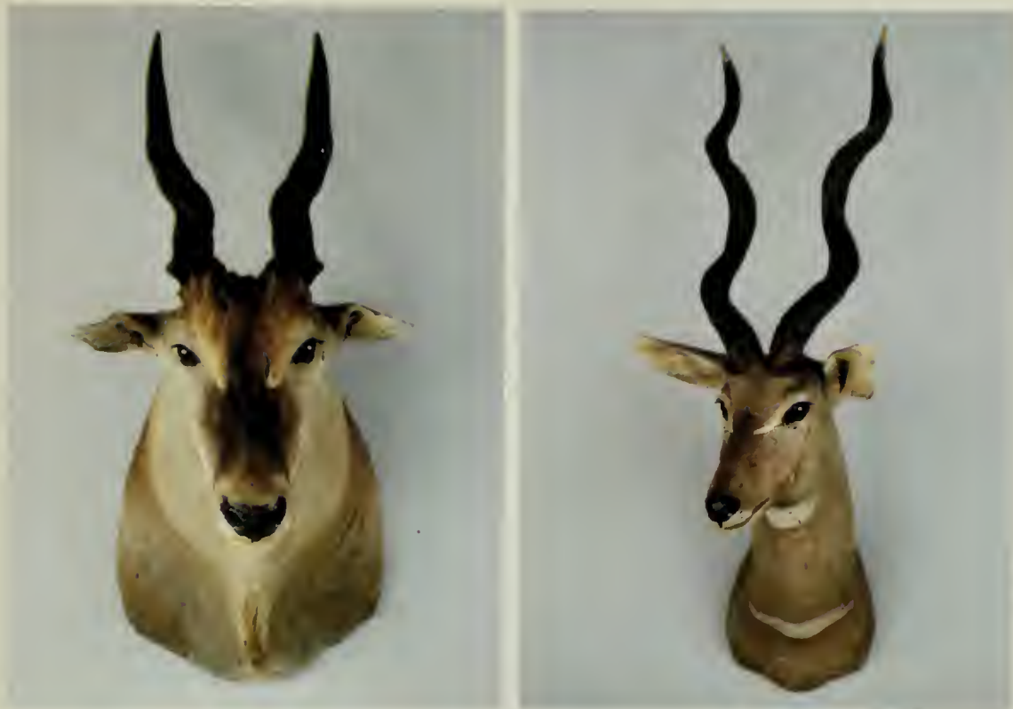
A sinistra: Antilope alcina del Kenia ( Taurotragus oryx pattersonianus Lydekker, 1906); a destra: Cudu minore del Kenia ( Tragelaphus imberbis australis Heller, 1913).